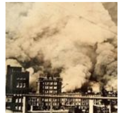
Alles over het verleden