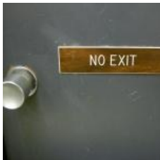
Ontslag, zo gaat dat