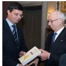
Balkenende en de Commissie-Davids