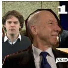
Nieuwsquiz: Speel mee en win die dvd-box!